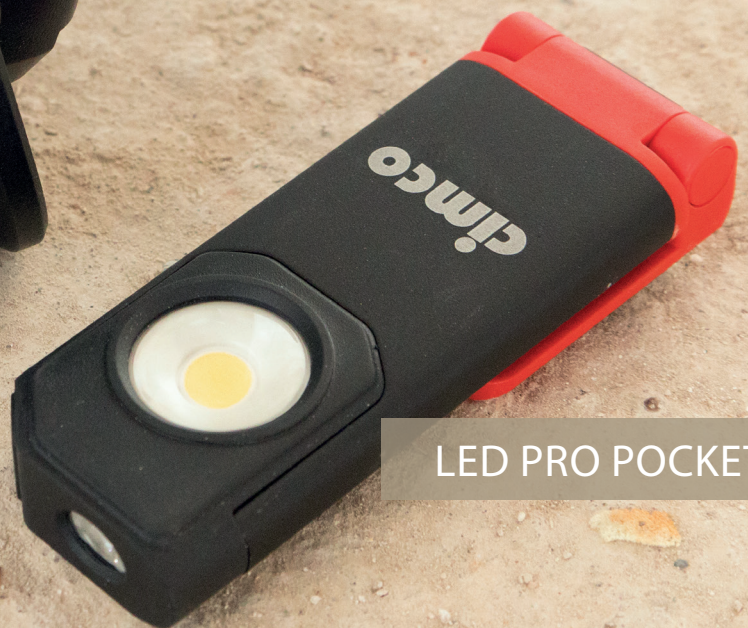
LED PRO POCKET