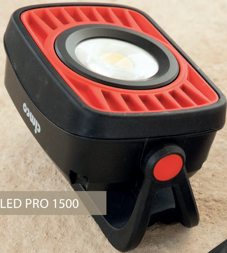
LED PRO 1500