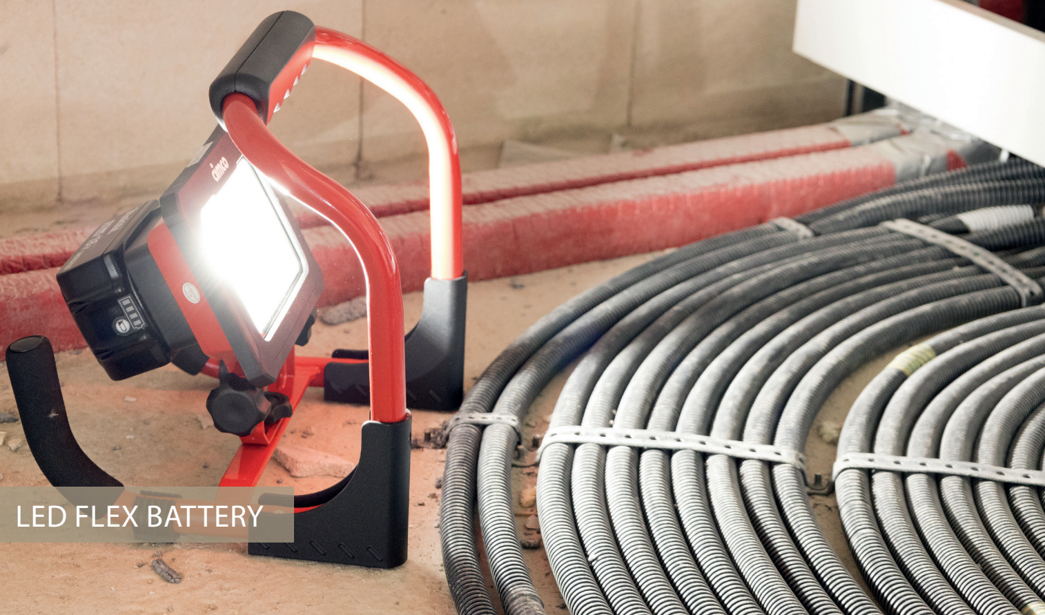
LED FLEX BATTERY